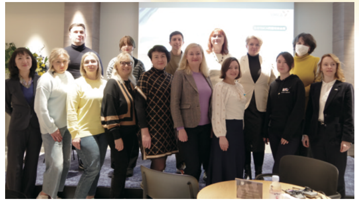
【昨年のフォーラム実施時の集合写真 2023年2月18日】

YMCAは世界各地で避難者支援を行い、日本ではこれまで1600名の支援-渡航から生活開始・自立に向けた伴走まで行っています。今回は、ウクライナ避難者の大規模な聞き取り調査結果と、あらゆる世代の当事者の声をわかち合い、私たちがこれから向かうべき道を共に探りたいと願います。