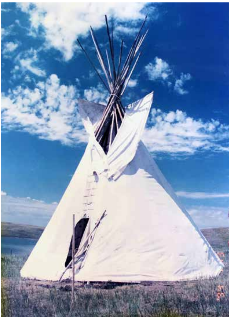
スー ( アメリカ先住民族 ) Y M C A における大平原の中のティーピーテント

ここでも、障がい児教育には全く無知であった私は、キャンプを通じてリーダーたちと共に実に多くの学びを障がい児や多数の子どもたちから得ました。Y M C Aが長く培ってきたいわゆるオーソドックスな組織教育キャンプに、様々な新しい形が加わりだした時期でもあったと言えるでしょう。