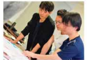
フォーラムにむけて、気持ちも高まる