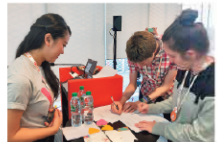
核兵器廃絶の署名も集まった

とはいえ、そんなこと本当に実現すると思っているのか、とよく聞かれます。正直分かりません。しかし「できるかもしれないからやる」ことが大切だと考えています。その思いを貫くために、私は草の根レベルで自分にできることに心を注ぎ、活動し続けます。