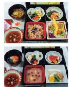
上が常食、下が嚥下(えんげ)食

YMCAサンホームでは高齢になっても、障がいがあっても食事を楽しんでいただくために、おいしいことはもちろんのこと、安全面や栄養面を考え、さらには食べる人の思いを知り、笑顔や会話が生まれる食事を提供できるように努めています。