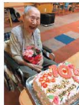
お誕生日おめでとうございます

などに配慮することで食の細かい方でも食べる量が多くなる場合があります。入居者の誕生日には、大きなケーキを作り、多くの人とお祝いをします。名前入りの自分だけの特別なケーキを見て、満面の笑みを浮かべる方、涙を流して喜ばれる方もいて、その表情や笑顔に私たちも喜びと感動をもらえます。