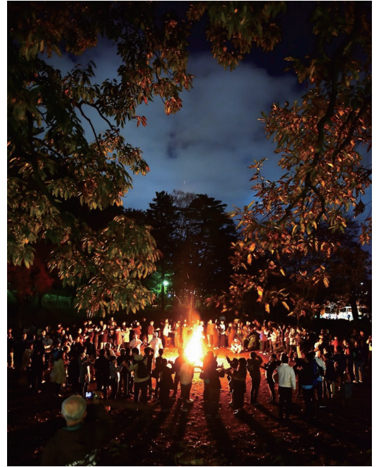
日本YMCA大会キャンプファイヤーより

昨今、さまざまな団体がキャンプを展開し、認知度も高くなっています。しかしYMCAキャンプがそれらより決定的に良い点、それはボランティアであるリーダーが指導者であることだと思っています。アルバイトではない学生の彼らが、強い想いをもってがむしゃらに駆け抜けていくその姿こそが、子どもたちにとって活きたお手本になると信じます。多様化した現代社会において、YMCA活動に「はまる」学生の数が減っていると聞くと胸が痛みますが、それでもボランティアリーダーこそがYMCAキャンプの中核であり、未来だと信じています。子どもたち、そしてリーダーという青少年を育てる、そのための環境を整備し提供する、そんなYMCAであり続けることを願ってやみません。