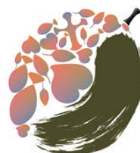
ユースアッセンブリーのロゴ