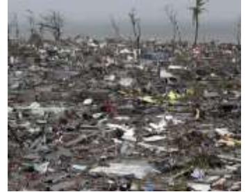
甚大な被害を受けたレイテ島タクロバン市

11月8日、台風30号の直撃を受けたフィリピン中部のビサヤ諸島では、犠牲者が1000人超になるとみられています。特に、レイテ島の中心都市タクロバン市では、暴風雨と高潮に見舞われ、住宅が濁流にさらわれるなど、甚大な被害に遭っています。報道によると、フィリピン全体で約950万人以上が被災し、約50万人以上が避難所などに避難しています。