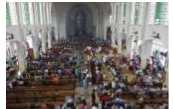
教会で避難生活を送る人々

これに対し、アジア太平洋YMCA同盟・フィリピンYMCA同盟より世界のYMCAに対し、緊急募金の呼びかけがなされました。セブYMCA(セブ島)やイロイロYMCA(パナイ島)など被災地にあるYMCAによる支援活動を支えます。