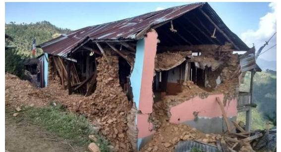
クルサニバリ村で倒壊した建物

5つのプロジェクトを運営実施するうえで、まずは第1期として45,000ドルの予算が策定されています。皆様からお預かりした募金も世界YMCA同盟と調整の上、順次拠出いたします。