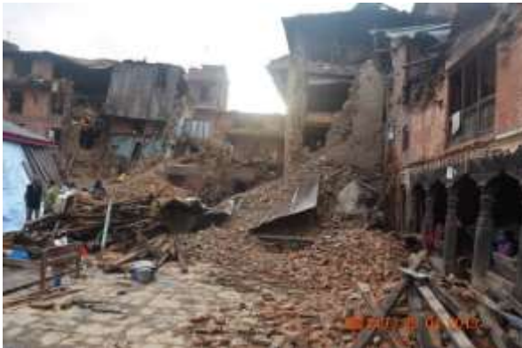
写真提供：ネパール YMCA Acharya 総主事

◆ ネパール YMCA Acharya 総主事より 「地震発生時、街は悲鳴と砂埃に包まれ、パニック状態でした。そして、食料だけでなく、医療物資などが不足し、今も人々は余震の恐怖に怯えています。特に被害が大きいと言われている、ラリトプール、カトマンズ、ヌワコットの地域にて、現地のユースを含めた30名と、まずは食料や水、テントや医薬品の配布を行います。」