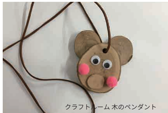
クラフトルーム 木のペンダント

事前にキャンプファイヤー場をご予約ください。薪組が不安な方は東山荘スタッフが準備させていただくことも可能です（有料 ¥1,000）。