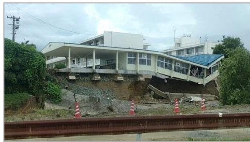
被害を受けた学校施設(朝倉)