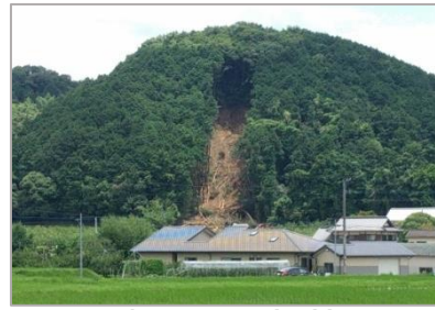
民家裏の山崩れ(朝倉)