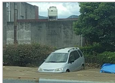
土砂に埋まった車(杷木)