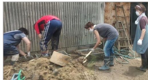
復旧作業をされる住民の方々(杷木)